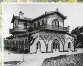
O Chalet da Condessa, após a construção

Criador do Parque e Palácio da Pena, D. Fernando II (1819-85) casou em segundas núpcias (1869) com Elise Hensler, Condessa d'Edla (1836-1929). Construíram ambos o Chalet da Condessa e o Jardim envolvente na zona ocidental do Parque da Pena entre 1864-69